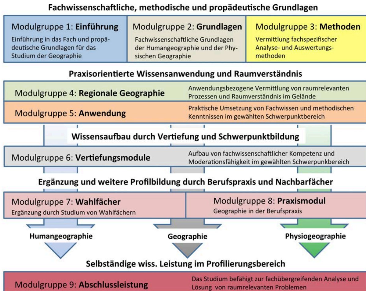
Abb. 1: Strukturdiagramm des Bachelor Geographie.

Ein Beginn ist zum Wintersemester empfohlen - bei einem Beginn im Sommersemester können Verzögerungen im Studium nicht ausgeschlossen werden.